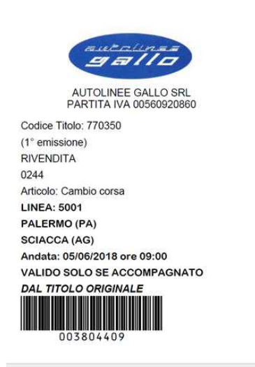
Illustrazione 13: esempio titolo generato con il cambio corse online

Facendo clic sul pulsante “ STAMPA ” sarà generato il biglietto con il nuovo orario (vedi illustrazione 13) che potrà essere esibito al personale di bordo sia su stampa cartacea che su smartphone.