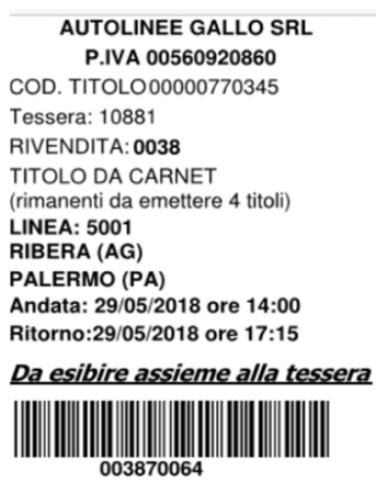
Illustrazione 3: esempio di titolo di viaggio emesso da carnet