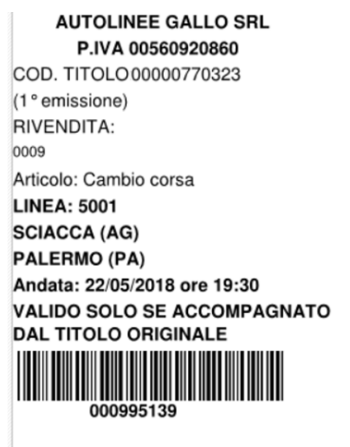
Illustrazione 8: esempio di un titolo di