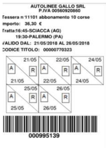
Illustrazione 1: esempio di abbonamento settimanale di 5 corse A/R