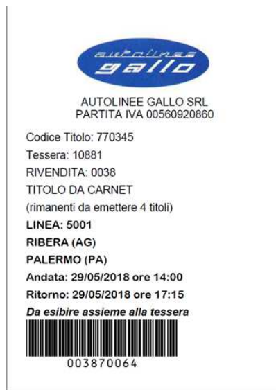
Illustrazione 7: esempio di titolo di viaggio emesso dal carnet

Al termine della procedura di conversione, il titolo apparirà sotto forma di icona nella parte alta della pagina di gestione del carnet nella sezione dei biglietti emessi in corso di validità. Facendo clic sull'icona che lo rappresenta, il biglietto sarà generato in formato “pdf” (vedi illustrazione 7) e potrà essere esibito su stampa cartacea o su smartphone al personale di bordo, che ne verificherà la validità.